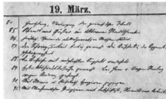
8 Tagebuchblatt von Heinrich Hertz