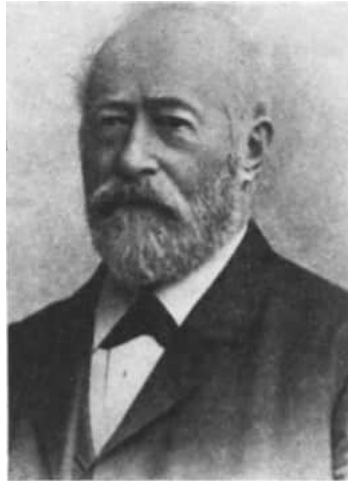
4 Vater von Heinrich und Großvater von Gustav Hertz