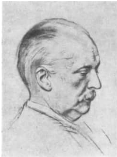
Hermann von Helmholtz (31. 8. 1821 bis 8. 9. 1894)

Heinrich Hertz schien prädestiniert zu sein, der Menschheit solche neue Einsicht in viele bisher verborgene Tiefen der Natur zu erschließen, ... , unter allen Schülern, die ich gehabt habe, durfte ich Hertz immer als denjenigen betrachten, der sich am tiefsten in meinen eigenen Kreis von wissenschaftlichen Gedanken eingelebt hatte, und auf den ich die sichersten Hoffnungen für ihre weitere Entwicklung und Bereicherung glaubte setzen zu dürfen.