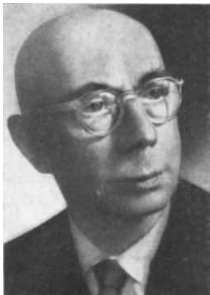
3 Gustav Hertz (22 . 7. 1887 bis 30. 10. 1975)

Sein Nachweis, dass Licht eine elektromagnetische Welle ist, war ein Ausgangspunkt in der Entwicklung der modernen Physik.