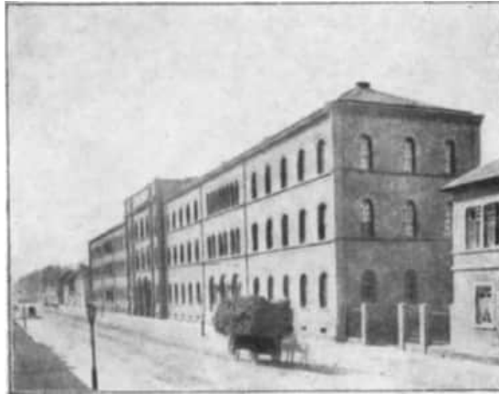
7 Technische Hochschule in Karlsruhe mit dem physikalischen Laboratorium zur Zeit von Heinrich Hertz

Heinrich Hertz reiste Ende März 1885 nach Karlsruhe, wo er an der Technischen Hochschule seine Tätigkeit als ordentlicher Professor der Physik aufnahm. Ihm stand ein Institut mit einer guten experimentellen Ausrüstung zur Verfügung. Hier gelangen ihm seine großen Entdeckungen, und hier begründete er seinen Weltruhm.