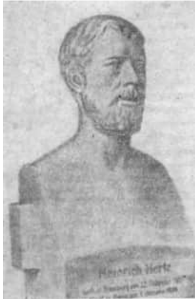
13 Büste von Heinrich Hertz, aufgestellt im Deutschen Museum in München

Die jüngere Tochter Mathilde modellierte eine Büste ihres Vaters. Diese Büste von Heinrich Hertz wird im Deutschen Museum in München aufbewahrt (Abb. 13).