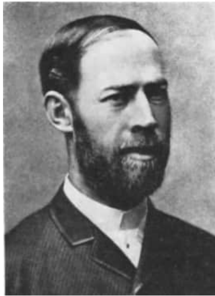
1 Heinrich Hertz (22. 2. 1857 bis 1. 1. 1894)

Heinrich Hertz lebte und wirkte in der zweiten Hälfte des 19. Jahrhunderts, einer Zeit, in der Naturwissenschaften und Technik sich rasch entwickelten. Die vorliegende Biographie gibt Auskunft über Einflüsse von Erziehung, Bildung und Umwelt auf die Entwicklung zum Naturforscher, über Quellen von Erfolgen und Misserfolgen, Motive bei der Auswahl von Forschungsgegenständen, die Wirkung von Forschungserkenntnissen und -ergebnissen sowie physikalischer und philosophischer Ideen in Wissenschaft, Technik und Gesellschaft.