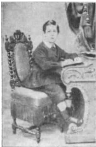
5 Heinrich Hertz im Dezember 1865

Auf die Frage der Mutter, ob denn Heins in der Schule beliebt sei, meinte der Lehrer, das könne er nicht beantworten, "jedenfalls staunten ihn alle an, da er alles wisse, oft ehe es gelehrt würde".