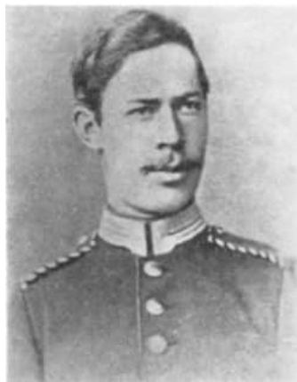
6 Heinrich Hertz 1877

Um die Eltern nicht allzu sehr zu ängstigen, berichtet er auch Erfreuliches vom Kommiss, der ihm, obwohl in einem unaufhörlichen Kampf, sogar Freude mache, insofern er seine Kräfte fordere und er verhältnismäßig ungeschoren hindurchkomme.