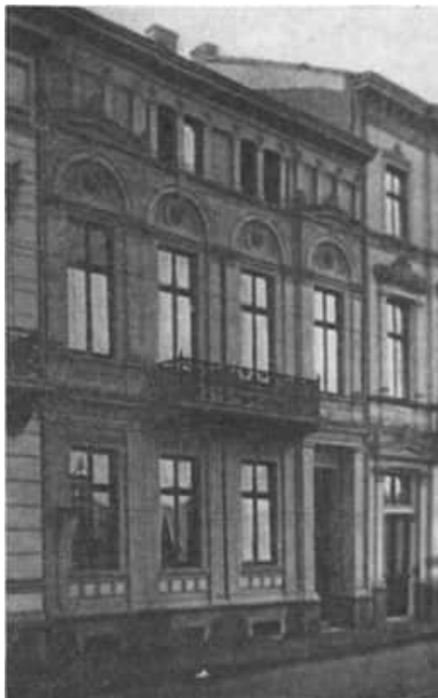
12 Heinrich Hertz' Wohnhaus in Bonn

Er erwartete sehnsüchtig die Ferien, um ausspannen zu können. Aber gerade in dieser Zeit erhielt er eine Einladung, auf der Naturforscherversammlung in Heidelberg zu sprechen. Die Abfassung dieses Vortrages bereitete ihm großen Kummer und viel Verdruss.