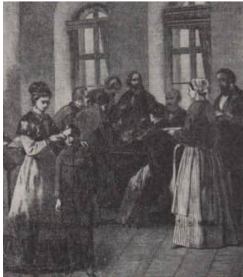
Abb. 8. Graefe bei einer Operation (Aus "Über Land und Meer" 1869)

"Nach Würzburg kamen zwei reizende Tage in Heidelberg. Es war während des Mittagessens im Garten des alten Schlosses wirklich rührend, die alten Gesichter aus der Carlstraße successive auftauchen zu sehen, voller Leben, voller Freude an diesem Beisammensein, voll von jugendlichem Frohsinn. Daß wir nicht bloß Ophthalmologie getrieben, bedarf wohl keiner Erwähnung, es ist auch wacker gekneipt worden; und selbst der gute Arlt bekam schließlich etwas burschikoses, als der Leistenwein von Neckarsteinach und deutsche Lieder allmählich die Scene änderten... Ich schlief die Nacht sehr schwer - kein Wunder nach dem vielen Wein und Randal und wurde von dem versammelten Kongreß in pleno am lendemain (Anm.: "vollzählig am folgenden Tage") zur letzten Sitzung geweckt."