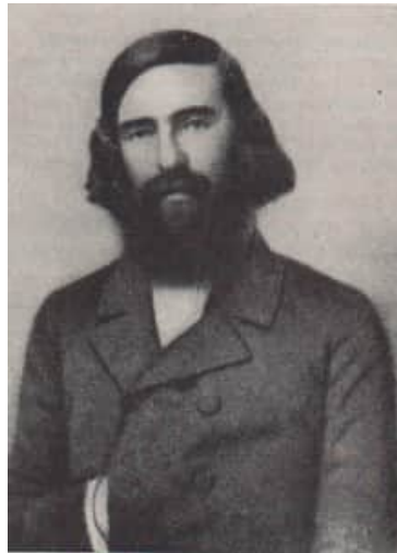
Abb. 10. Albrecht von Graefe im Jahre 1864

Dabei wurde nur teilweise das Schicksal berührt, das ihn heimgesucht hat, niemals in vollem Umfange. Auf diese Weise ist in der Literatur, in der Geschichte der Medizin - abgesehen von der zum frühen Tode führenden Lungenkrankheit - ein Bild des strahlenden, kaum von Kummer getrüben Genies entstanden. Aber er hat harte Schicksalsschläge hinnehmen müssen.