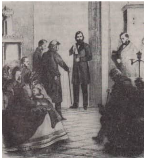
Abb. 9. In Graefes Vorzimmer (Aus "Daheim" 1865)

Der berühmte Augenarzt Graefe erhielt für eine Augenoperation, welche er an mir vorgenommen hatte, fünf Friedrichsdor gleich 85 Mark."