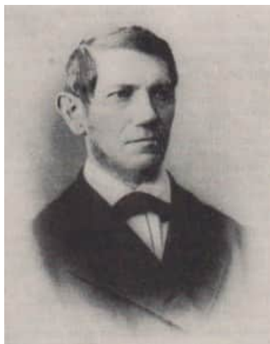
Abb. 4. Ferdinand Arlt

Glaube mir, ohne Prag würden mir Paris und Wien kaum so viel genutzt haben, ja ich denke, ohne Arlt würde ich vielleicht gar nicht als Ophthalmologe nach Berlin zurückgekehrt sein."