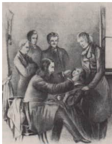
Abb. 6. Albrecht von Graefe (sitzend) während einer Augenoperation. Hinter ihm stehend A. Schuff (Aus "Gartenlaube" 1857)

Die Augenklinik lag völlig am Rande der Stadt, am sogenannten "Unterbaum". Hier floss die Spree vorbei, deren Unterlauf tatsächlich mit einem an Ketten befestigten Baumstamm abgesperrt war; am Oberlauf lag der "Oberbaum".