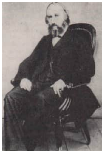
Abb. 11. Letztes Porträt Albrecht von Graefes aus dem Jahre 1870

Der Tod endete am Mittwoch, dem 20. Juli 1870, morgens um 3.00 Uhr, sein arbeitsreiches, sein erfülltes und dennoch oft so schweres Leben.