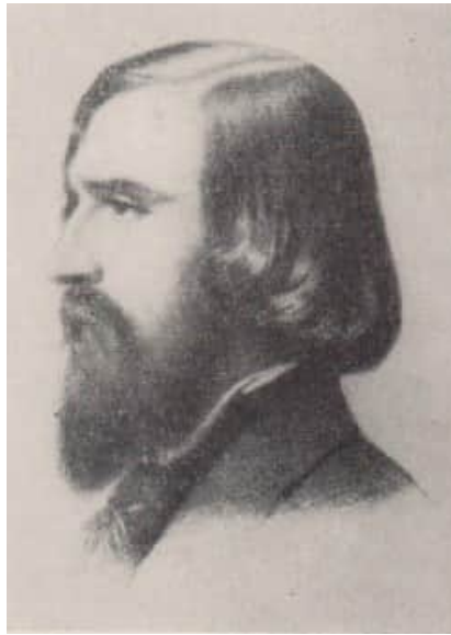
Abb. 1. Albrecht von Graefe im Jahre 1857

O, eine edle Himmelsgabe ist das Licht der Augen! Alle Wesen leben vom Lichte, jedes glückliche Geschöpf - die Pflanze selbst - kehrt freudig sich zum Lichte.