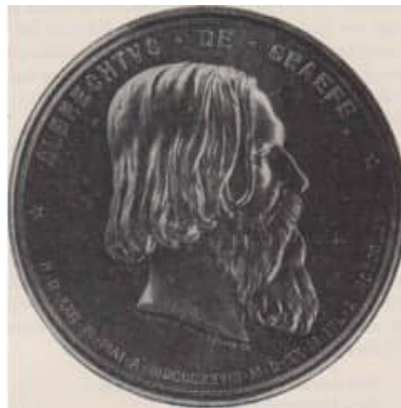
Abb. 12. Graefe-Medaille

Im Jahre 1885 stiftete die Ophthalmologische Gesellschaft die "Graefe-Medaille" und verlieh sie nach einstimmigem Beschluss erstmals im Jahre 1886 an den inzwischen 65jährigen Hermann von Helmholtz. Aus Spenden und Stiftungen wurde eine Sammlung von Originalgegenständen, Handschriften und Büchern von und über Albrecht von Graefe und seine Zeit zusammengetragen und in der Universitäts-Augenklinik Heidelberg als "Graefe-Museum" eingerichtet.