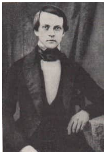
Abb. 5. Hermann Helmholtz

Er war weder gelehrt, noch geschickt, hat nie etwas Wissenschaftliches veröffentlicht und nie operiert, half aber unermüdlich in Poliklinik und Privatsprechstunde, er war immer zur Stelle. So bescheiden, wie er gelebt hat, so still ist er 1870 noch vor Albrecht von Graefe gestorben.