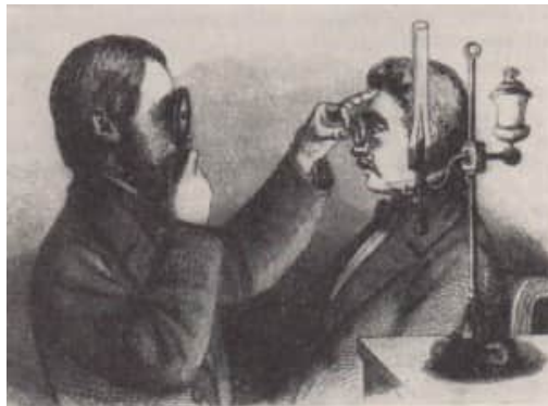
Abb. 7. Handhabung des Augenspiegels im Jahre 1862

hypothetisch aufgestellte Erklärung der Stauungszeichen im Augenhintergrund konnte zwar ursächlich durch neue Befunde erweitert, aber nicht grundsätzlich verändert werden.