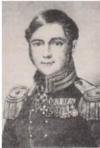
Abb. 3. Carl Ferdinand von Graefe Manuskript einer Arbeit über Glaukom

Den Wanderlappen hat dagegen der italienische Chirurg Gaspar Tagliacozzi (1546-41599) aus Bologna eingeführt: Aus der Haut eines Oberarmes wurde die neue Nase geformt und im Gesicht angenäht, der Hautlappen blieb aber über eine Brücke solange noch mit dem Arm in Verbindung, bis der Anteil im Gesicht fest angewachsen war.