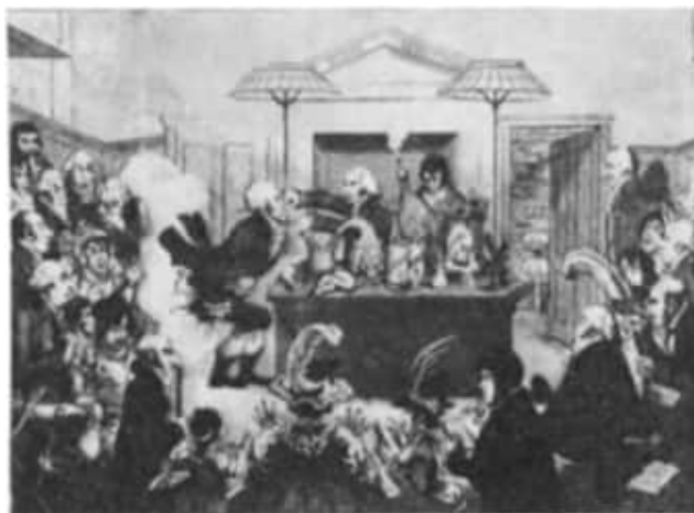
3 "Wissenschaftliche Forschungen! Neue Entdeckungen der pneumatischen Chemie! oder eine Experimentalvorlesung über die Kraft der Luft".

Rumford musste sich also rechtzeitig nach einem Nachfolger umsehen, den er nun in Davy zu finden hoffte. Die Empfehlungen sowie die ähnliche Auffassung beider zur Wärmetheorie hatten Davy den Weg an die Royal Institution geebnet, auch wenn Rumford dem Auftreten Davys zunächst mit Skepsis entgegensah.