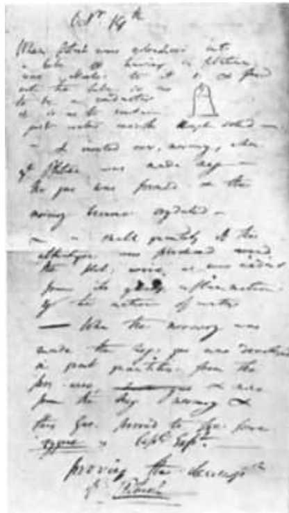
7 Seite aus dem Protokollbuch Davys. Beschreibung des Versuchs zur elektrolytischen Zerlegung von Pottasche.

Bei der Unterstützung für Stephenson mag Lokalpatriotismus im Spiel gewesen sein. Sir Joseph Banks war von Davys Erfindung beeindruckt, und so stellte sich die Royal Society hinter Davy.