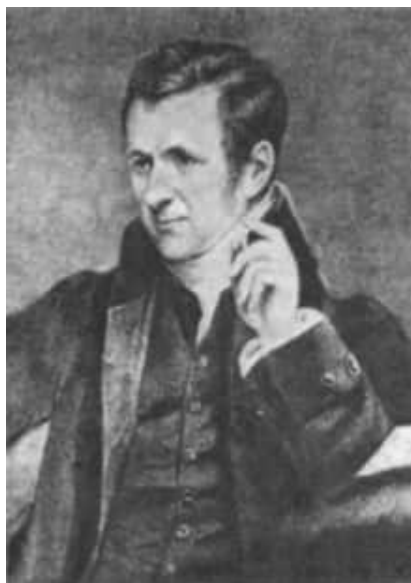
8 Humphry Davy um 1820. Stich nach einem Gemälde von J. Lonsdale (Ausschnitt).

Nach außen hin nahm die Royal Society zwar keinen Schaden, denn Davys Ruhm war groß genug, um innere Schwierigkeiten der Gesellschaft zu überdecken. Allerdings waren die Zusammenkünfte der Mitglieder nicht mehr die glänzenden Diskussionsrunden im Kreise eines Sir Joseph Banks. Davys Unternehmungen als Präsident der Royal Society waren wenig erfolgreich. Weder die Einrichtung von Laboratorien für die Gesellschaft noch die Gründung eines "British Museum of Natural History" gelangen.