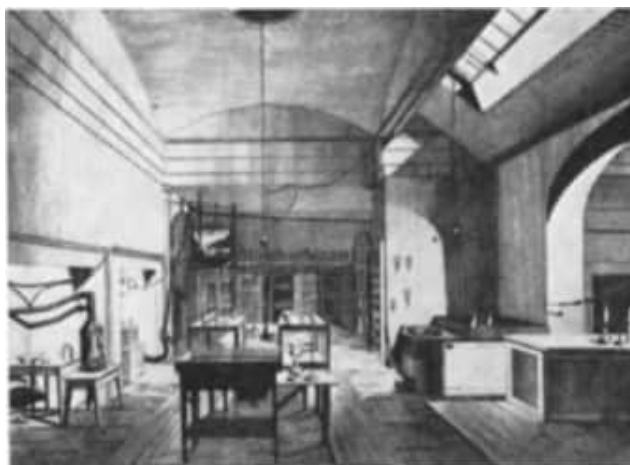
5 Davys Laboratorium an der Royal Institution. Die vorbildliche Ordnung weist darauf hin, dass Davys Nachfolger W. T. Brande hier bereits eingezogen ist.

Aus der von Cruikshank sowie von Gay-Lussac und Thenard beobachteten Tatsache, dass sich Wasserstoff mit Scheeles "dephlogistierter Salzsäure" zu Salzsäure verbindet, ließ sich nun auch deren Zusammensetzung als Chlorwasserstoff angeben.