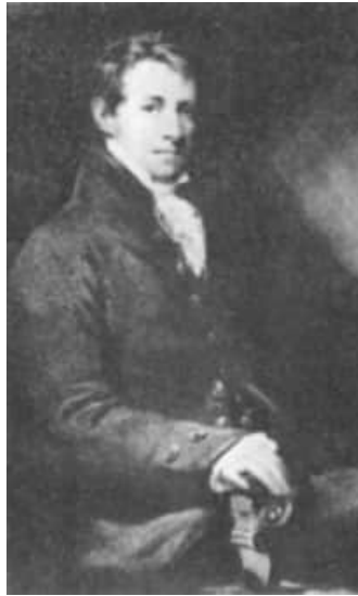
1 Humphry Davy (17.12.1778 bis 29.5.1829)

Das Porträt von John Jackson aus dem Jahre 1823 zeigt Humphry Davy als Präsidenten der Royal Society