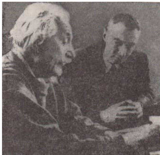
23 Oppenheimer und Einstein in Princeton