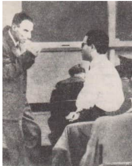
4 Oppenheimer im Hörsaal in seiner typischen Haltung mit Zigarette

Oppenheimers Start in Berkeley war nicht gerade glänzend. Bald beschwerten sich seine Studenten, dass er zu leise spreche, zu schnell vorwärts gehe und auch ansonsten unmöglich sei. Als er im Frühjahrssemester am Cal. Tech. las, besuchte der mit Oppenheimer befreundete Richard Tolman, Professor an dieser Hochschule und einer der Begründer der relativistischen Thermodynamik, seine Vorlesung und meinte hinterher zu ihm: "Well, Robert, das war wunderbar, aber ich habe kein verdammtes Wort verstanden." (Nach [51, S. 55])