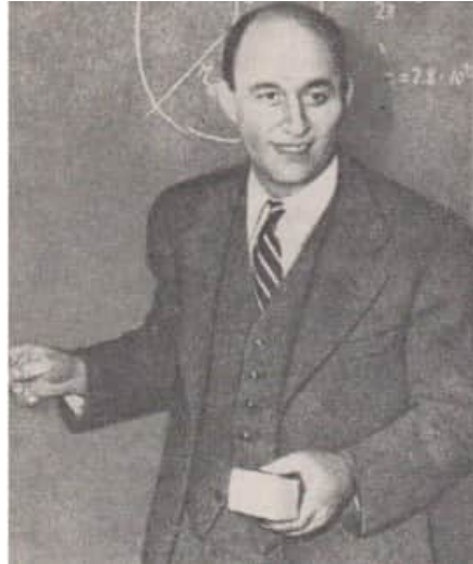
12 Enrico Fermi

ßes begonnen werden musste, bevor die Verfahren technologisch durchgearbeitet waren, ja bevor überhaupt klar war, ob sie funktionieren würden. So hatte man beispielsweise im Oktober 1943 noch keinen geeigneten Filter für das Gasdiffusionsverfahren entwickeln können, und noch im April 1944, als die Produktion aufgenommen werden sollte, war dieser Filter nicht einsatzbereit.