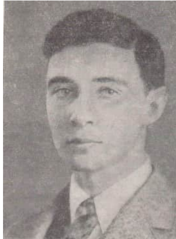
2 Oppenheimer im Jahre 1925

Bridgman übersah auch nicht, dass Oppenheimers Fähigkeiten ein Resultat aus Frühreife und Unreife waren, und erzählte noch später folgende Episode: