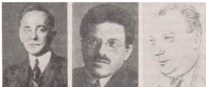
3 Oppenheimers Physik-Lehrer in Europa (von links nach rechts): Max Born in Göttingen, Paul Ehrenfest in Leiden, Wolfgang Pauli in Zürich

Deshalb möchte ich sehr gerne, dass er, wenn er von Leiden weiterzieht ... zu Ihnen kommen kann ..." [46, S. 477]