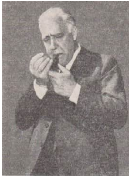
6 Niels Bohr

Meitner und Frisch erkannten, dass die theoretische Erklärung dieser Vorgänge mit Hilfe des von Bohr 1937 postulierten Tröpfchenmodells des Kernes zu finden sei: Durch das eingefangene Neutron verändert sich die Stabilität des Kernes, er zieht sich in die Länge, schnürt sich ein, und schließlich erfolgt die Trennung. Diese Ergebnisse veröffentlichten beide im Februar 1939 in der "Nature" (vgl. [145]).