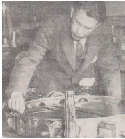
11 Ernest O. Lawrence am 37 1/2-Zoll-Zyklotron

Das Laboratorium von Berkeley war auf diesem Gebiet führend geworden. Für Lawrence bedauerlich war dabei, dass ihm trotz dieser leistungsfähigen Geräte einige Entdeckungen auf dem Gebiet der Kernphysik entgingen, wie insbesondere 1934 die Entdeckung der künstlichen Radioaktivität. Einige seiner Biographen meinen, dies sei seiner Sucht nach immer größeren Geräten geschuldet, worüber er vergaß, die Geräte zur Forschung einzusetzen, aber einige objektive Faktoren spielten dabei wohl auch eine Rolle.