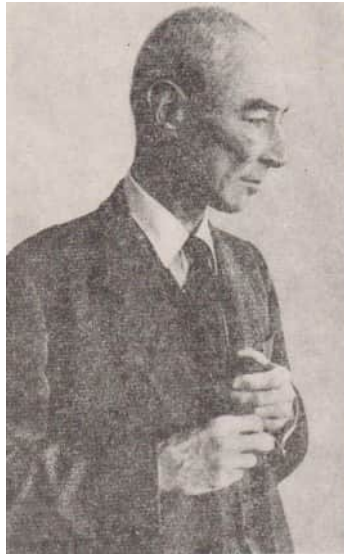
1 J. Robert Oppenheimer (22. 4. 1904 bis 18. 2. 1967)

J. Robert Oppenheimer wird häufig als der "Vater der amerikanischen Atombombe" bezeichnet. Schöpfer der wohl schrecklichsten Vernichtungswaffe zu sein, die die Menschheit kennt und deren Ersteinsatz im August 1945 - 40 Jahre vor Erscheinen dieses Buches - die japanischen Städte Hiroshima und Nagasaki dem Erdboden gleichmachte, ist sicher ein recht zweifelhafter Ruhm. Oppenheimer gehörte durchaus nicht zu jener Sorte Mensch, die auf eine solche Tat sonderlich stolz waren, wenngleich er sogar an der Einsatzentscheidung nicht ganz unbeteiligt war.