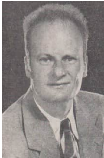
14 Hans Bethe, der Leiter der theoretischen Gruppe in Los Alamos

Für die weitere Arbeit wurden 4 Abteilungen geschaffen: Experimentalphysik, Leitung Robert Bacher, ein Radarfachmann; Theoretische Physik, Leitung Hans Bethe; Chemie und Metallurgie, Leitung Joseph W. Kennedy, und "Artillerie" für die eigentliche Bombenkonstruktion, Leitung Hauptmann William Parsons. Jede dieser Abteilungen bestand aus mehreren Gruppen. Die Abteilungsleiter unterstanden dem Direktor.