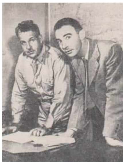
13 Oppenheimer und Groves bei einer Beratung 1945

Ein Knabeninternat stellte die einzigen Gebäude auf diesem 2000 m hohen Plateau, eine holprige Zufahrtsstraße führte von dem 40 Meilen entfernten Santa Fe dorthin. Dieser Ort erschien allen Beteiligten als gut geeignet und wurde bestätigt. Die Gebäude der Knabenschule konnten die ersten Räume für die Wissenschaftler abgeben; da die finanzielle Situation der Schule nicht besonders gut war, gab es beim Ankauf keine großen Probleme.