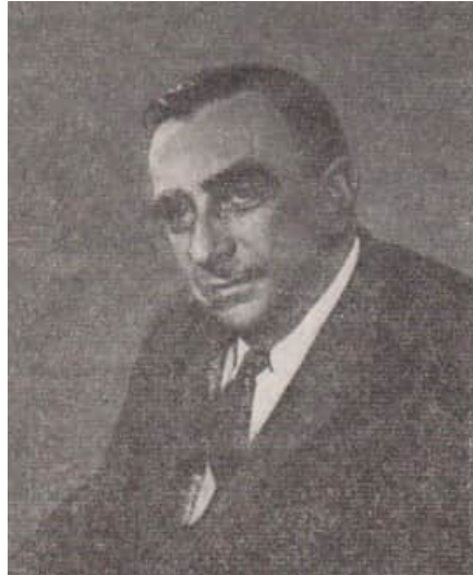
21 Edward Teller

Eigentlich waren Gamow und Teller ein gegensätzliches Gespann.