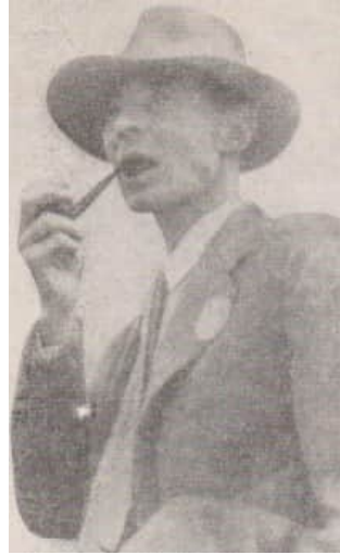
16 Oppenheimer in Trinity, von den Anstrengungen gezeichnet, mit seinen "Insignien" Pfeife und breitkrempigem Hut

tigt. In Los Alamos wurde in diesen Tagen nicht nur das Plutonium-Aggregat für den Test fertiggestellt, sondern zugleich wurden zwei Bomben für den Einsatz produziert: eine Uranbombe und eine Plutoniumbombe. Damit war dann alles Spaltmaterial verbraucht, das Oak Ridge und Hanford zu diesem Zeitpunkt liefern konnten.