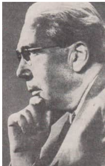
7 Leo Szilard

Mit seiner Habilitationsschrift lieferte Szilard dann einen wichtigen Baustein zur heutigen Informationstheorie. Gemeinsam mit Einstein verfasste er mehrere Patente über eine spezielle Kältemaschine, und die damit zusammenhängende Einstein-Szilard-Pumpe spielte später in kerntechnischen Anlagen eine Rolle. Ein finanzieller Erfolg blieb jedoch aus, obwohl die AEG sich dafür interessierte.