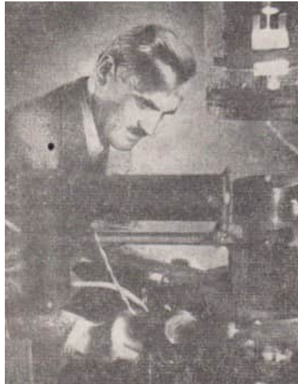
9 Arthur Compton im Labor