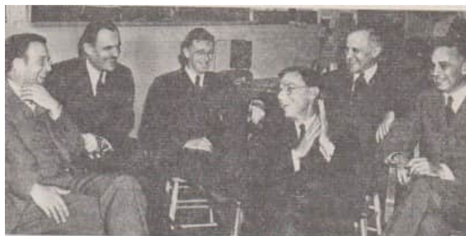
10 Einige der späteren wissenschaftlichen Leiter des S-1-Projektes bei einer Beratung im März 1940 in Berkeley: E.O. Lawrence, A. Compton, V. Bush, J. B. Conant, K. Compton, A.L. Loomis (von links nach rechts)

als Stellvertreter von Bush sowie Arthur Compton, Lawrence und Urey als Programmchefs. Diese Sektion S-1 wurde am 6. Dezember 1941 gebildet, einen Tag vor Pearl Harbor (Abb. 10).