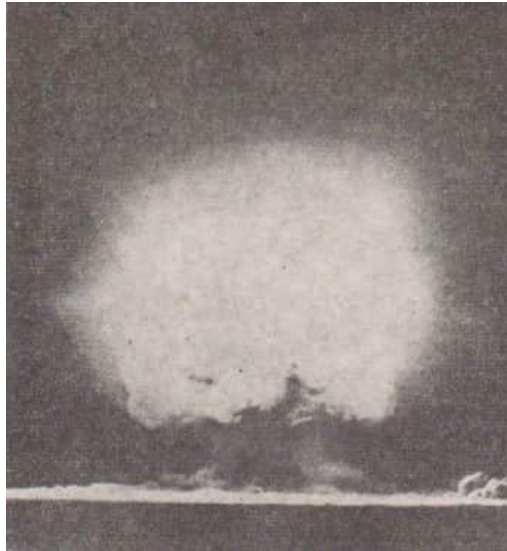
17 Explosion der ersten Kernspaltungsbombe beim Trinity-Test am 16. Juli 1945

Regnerisches Wetter über dem Testgelände ließ die Stimmung nicht optimistischer werden. Schlaf fand in der letzten Nacht kaum jemand. Groves, Bush und Conant waren anwesend, dazu die führenden Wissenschaftler von Los Alamos und einige wenige weitere wie Lawrence oder Rabi, und auch an einen Journalisten hatte Groves gedacht, William L. Laurence von der New York Times, der später dem amerikanischen Zeitungsleser alles recht eindrucksvoll schildern sollte (vgl. [115]); auf politische und militärische Prominenz wurde aber verzichtet, um die Geheimhaltung zu wahren.