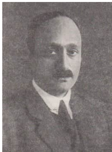
18 James Franck

Am 6. Juni informierte Stimson Präsident Truman über das Ergebnis der Beratung. Bei aller Geheimhaltung über den Inhalt der Sitzung des Interim-Komitees erhielten die vier Wissenschaftler die Erlaubnis, in ihren Laboratorien mitzuteilen, dass eine solche Beratung stattgefunden habe. Damit sollten jene, die in letzter Zeit die öffentliche Kontrolle der Atomenergie gefordert hatten, beruhigt werden, dass alles ganz verantwortungsvoll zugehe. Im Chicagoer Laboratorium war man jedoch misstrauisch, und Compton konnte nicht verhindern, dass die Diskussionen über die Folgen der Atombombe weitergeführt wurden.