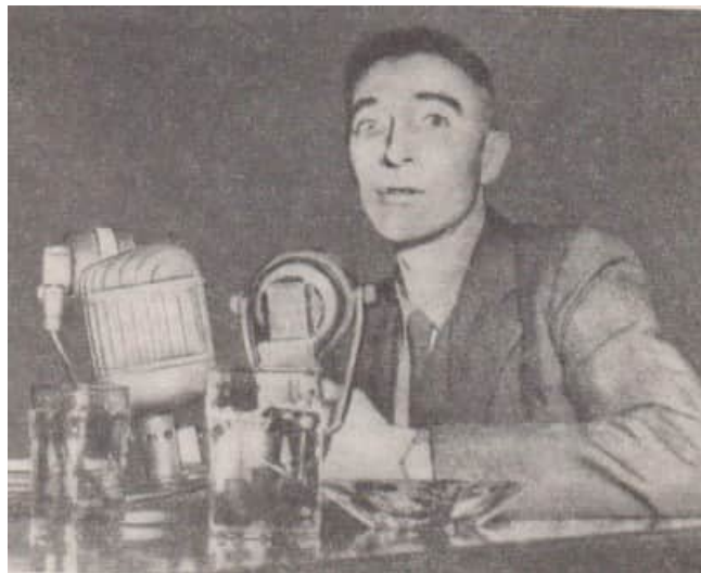
20 Oppenheimer vor dem Kongressausschuss für Atomenergie im Juni 1949

Ein beliebtes Mittel, Druck auszuüben, war die Sicherheitsfreigabe. So wurde Lilienthal, der unter Roosevelt jahrelang auf Regierungsposten tätig war, erst nach zehnwöchigen "Hearings" vom Senat bestätigt, Oppenheimer gar erst nach einem halben Jahr.