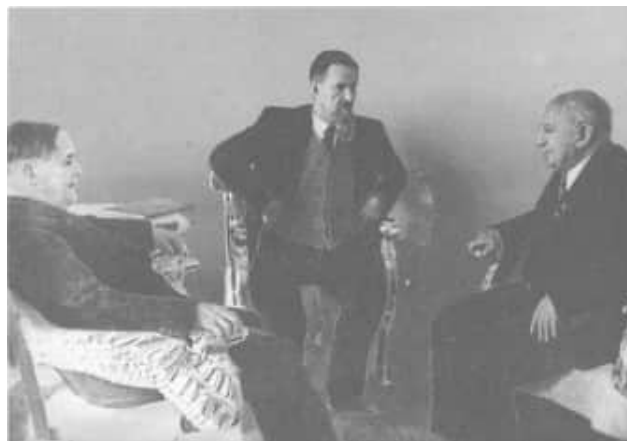
18 Diskussion zwischen P.L. Kapica, I. V. Kurtatov und A. F. Ioffe (von links nach rechts) in den Räumen des Akademiepräsidiums 1959.

Andererseits war Ioffes Schule darauf nicht ausschließlich festgelegt - seine Schüler arbeiteten auf fast allen Gebieten der Physik.