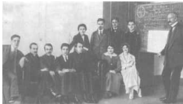
6 Teilnehmer des Seminars von A.F. Ioffe im Jahre 1916 (die Aufnahme hat Kapica mit Selbstauslöser gemacht), sitzend von links nach rechts: P. L. Kapica, J. I. Frenkel, N. N. Semenov, K. F. Nesturch, P. I. Lukirskij, I. K. Bobr, M. V. Milovidova-Kirpiteva; stehend von links nach rechts: J. R. Smidt-Cernyseva, N. I. Dobronravov, A. P. Justenko, J. G. Dorfman, an der Tafel A. F. Ioffe

Schon die ersten Kriegsmonate offenbarten die technisch-ökonomische Rückständigkeit Russlands drastisch. Neben kurzfristig eingeleiteten Maßnahmen, mit denen versucht wurde, die Kriegswirtschaft anzukurbeln und wenigstens das Notwendigste bereitzustellen, ergaben sich auch einige längerfristig orientierte Schlussfolgerungen.