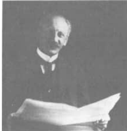
7 A.F.Ioffe um 1920 in seiner Wohnung im Polytechnischen Institut

sik zur wissenschaftlichen Basis der künftigen sozialistischen Technik machen könnte" [17, S. 499]. Inhaltlich entsprach dies eigentlich genau dem, was die KEPS in ihren Ansichten über den wissenschaftlichen Aufbau vorgeschlagen hatte. - Überlegungen dazu hatte es bei Ioffe in den vorangegangenen Jahren bereits mehrfach gegeben.