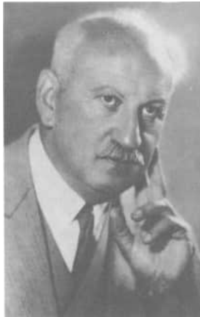
1 Abram Fedorovič Ioffe (29.10.1880—14.10. 1960) im Jahre 1940

Vorwort Abram Fedorovič Ioffe wird häufig als "Vater der sowjetischen Physik" bezeichnet, manchmal auch als "Vater der Halbleiterphysik". Diese Ehrenbezeichnung verdankt der weltbekannte Wissenschaftler nicht nur seinen hervorragenden Forschungsleistungen - speziell auf dem Gebiet der Festkörperphysik -, sondern vor allem und zugleich seiner weitsichtigen wissenschaftsorganisatorischen wie wissenschaftsleitenden Arbeit, verbunden mit der Fähigkeit, begabte junge Physiker zu hohen Leistungen anzuregen und eine wissenschaftliche Schule hoher Effektivität zu entwickeln.