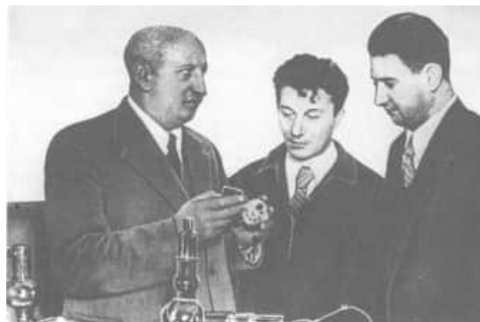
14 A.F.Ioffe, A.I. Alichanov und I.V.Kurcatov (von links nach rechts) im Laboratorium im Jahre 1938,

"Das wahrscheinlich zurückgebliebenste Teilgebiet in der sowjetischen Physik ist die Frage nach dem Aufbau des Atomkerns", schrieben Ioffe und Nasledov 1934 [20, S.36]. Zwar hatte Ioffe seine Mitarbeiter stets angehalten, alle neuen Richtungen der Physik genau zu verfolgen, auch solche, die noch keinen praktischen Nutzen erkennen lassen, denn in der Physik zeige die Geschichte, "dass selbst die in ihrer Zeit abstraktesten Arbeiten in der Zukunft unerwartete reichliche Anwendungen in der Technik finden" [20, S. 36], doch praktisch war es notwendig, auf verschiedenen Gebieten auch in dieser Hinsicht mehr zu tun.