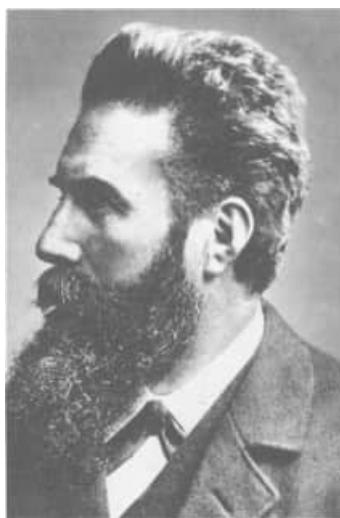
2 Wilhelm Conrad Röntgen, langes physikalischer Lehrer in München

Boltzmann war nur vier Jahre geblieben, und seitdem war das theoretische Ordinariat vakant. Röntgen war im Grunde ein Experimentalphysiker konservativer Art: er glaubte nur an experimentell nachweisbare Fakten und war pedantisch genau bei der Versuchsdurchführung.