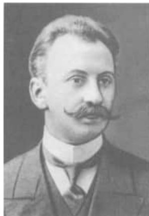
3 A.F. Ioffe im Jahre 1910

"Sie sind wirklich ein merkwürdiger Mensch", äußerte Röntgen daraufhin [109, S. 24]. Noch bis zum Sommer 1906 belegte Ioffe bei Röntgen das Physikalische Praktikum [132.1].