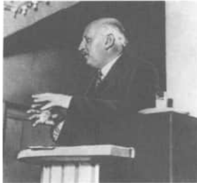
13 A.F.Ioffe bei einem Vortrag in Leningrad 1933

In diesem zweiten Aspekt ist für Ioffe vor allem die Forschung enthalten, die wir heute als Grundlagenforschung bezeichnen. Ein Blick auf seine eigenen Forschungsthemen zeigt, dass er sie unter diesen Gesichtspunkten auswählte. Wie gezeigt wurde, stand z.B. Ioffes Beschäftigung mit den elektrischen Eigenschaften der Dielektrika in engem Zusammenhang mit Anforderungen aus dem GOELRO-Plan.