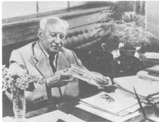
17 A.F.Ioffe in seinem Arbeitszimmer im Halbleiterinstitut im Jahre 1958.

methodologisch orientierten Theorieverständnis entsprach.