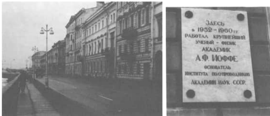
16 a) Gebäude des Instituts für Halbleiter am Leningrader Nevaufer (2.Gebäude v.r.) b) Gedenktafel am Gebäude (Aufnahmen 1986)

"... schön von Aussen und besonders im Innern." (Brief vom 17. Februar 1957 [134])