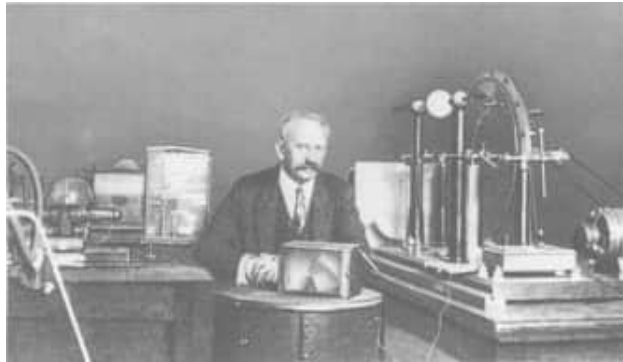
8 A.F.Ioffe 1924 im physikalischen Laboratorium des Polytechnischen Instituts

1923 im Polytechnischen Institut verbleiben, dann konnte es schräg gegenüber ein eigenes, inzwischen entsprechend umgebautes zweigeschossiges Gebäude beziehen, ein ehemaliges Militärhospital.