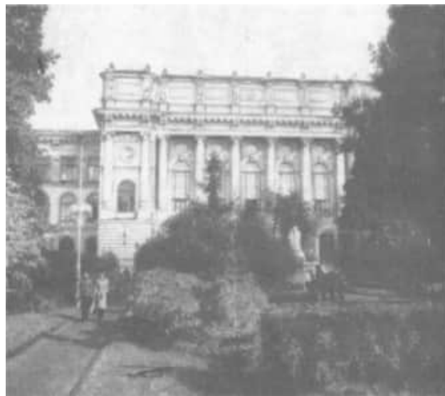
4 Hauptgebäude des Polytechnischen Instituts in Leningrad. Hier veranstaltete Ioffe sein Physik-Seminar, und von 1918-1923 beherbergte es auch das Physikalisch-Technische Institut (Aufnahme um 1975).

Das Polytechnische Institut unterstand "nicht dem Bildungsministerium, sondern dem Ministerium für Handel und Industrie, hatte relativ gute materielle Mittel zur Verfügung und sollte eine praxisgerechte Ausbildung auf hohem Niveau und nach modernen Methoden realisieren. Vorbild war die Technische Hochschule Berlin, die Krylov, einer der Initiatoren des Polytechnischen Instituts, 1898 besucht und in einem ausführlichen Reisebericht an die zuständigen Dienststellen geschildert hatte [54, S. 113ff.].