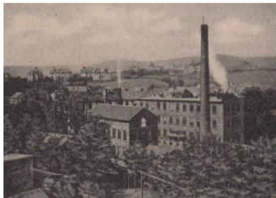
Zeiss-Werk um 1890

Abbe richtete auch neue Abteilungen ein, die das Werk weitgehend von der Zulieferung mechanischer Halbfertigfabrikate frei machten. Er griff aktiv in die Werbung ein, wobei ihm sein Ruf als Wissenschaftler zugute kam. Von ihm ging auch die Initiative aus, weitere feinmechanisch-optische Geräte in das Produktionsprogramm aufzunehmen.