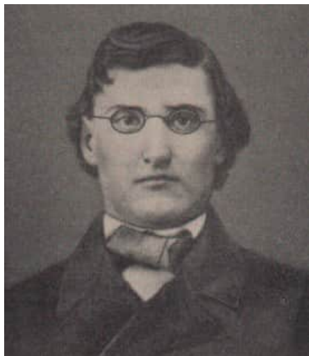
Ernst Abbe als junger Dozent 1863