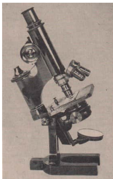
Im Zeiss-Werk nach Abbes wissenschaftlich-technischen Erkenntnissen gebautes Mikroskop, mit dem Robert Koch seine berühmten Entdeckungen machte

Zunächst studierte er gründlich den damaligen Stand des Mikroskopbaus, sorgte bald für rationellere Arbeitsmethoden und entwickelte neue Hilfsmittel für die Prüfung und die Kontrolle des fertigen Gerätes: Z. B. schuf er 1867 ein Fokometer (ein Gerät zur Brennweitenmessung). Auch photometrische Probleme, die ihm bei Fragen der Helligkeit der mit den Objektiven erzeugten Bilder begegneten, beschäftigten ihn in dieser Zeit.