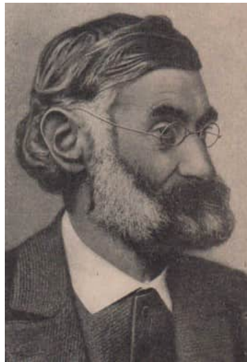
Ernst Abbe um 1900

Ernst Abbe zählt zu den deutschen Physikern, die in der Wissenschaftsgeschichte einen ehrenvollen Platz einnehmen. Sein wissenschaftliches und wissenschaftlich-technisches Werk bildet auch heute noch die Grundlage für den Bau vieler optischer Instrumente. Aber Ernst Abbe war nicht nur ein genialer Naturforscher und großer Erfinder, sondern auch kapitalistischer Unternehmer und als bürgerlicher Demokrat Sozialreformer. So ist sein gesellschaftliches Wirken unter kapitalistischen Verhältnissen voller innerer Widersprüche.