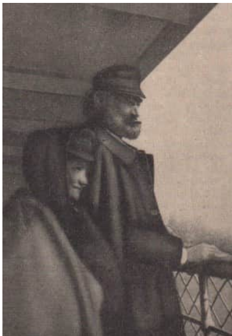
Ernst Abbe mit seiner Frau während einer Mittelmeerreise 1903

Abbe selbst stellte diese Forderung "nicht aus Liebe für die Sozialdemokratie oder den sogenannten Zukunftsstaat, sondern aus gerechter Gegnerschaft gegen alle unsicheren Falschliberalen, in richtiger Erkenntnis der Gefahr, die für die Volksrechte und das Volkswohl in allem Halben und Wankelmütigen liegt."