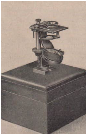
Mikroskop aus der Werkstatt von Carl Zeiss, gebaut 1847

In Abbe reifte der Gedanke, die notwendigen Krümmungen der Linsen aufs genaueste zu berechnen, die vorteilhaftesten Formen und Maße der mechanischen Teile zeichnerisch festzulegen und die Mikroskope nach solchen Vorlagen zu konstruieren. Welch erwartungsvolle Spannung mag Abbe wohl beherrscht haben, als er zum ersten Mal durch das vor ihm berechnete und von Carl Zeiss gebaute Linsensystem schaute und welche Enttäuschung muss er empfunden haben, als die mikroskopischen Objekte stumpfer und leerer erschienen, als die der "geprübelten" Systeme.