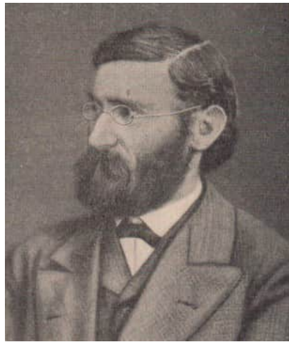
Ernst Abbe im Jahre 1876

Mit Hilfe der neuen Gläser konnte Abbe neue Objektive konstruieren, durch die die erwähnten störenden Farbränder vermieden wurden. Eines dieser Objektive ist das in aller Welt bekannte Apochromat. Ein apochromatisches Immersionsobjektiv z. B. besteht aus 10 Linsen, deren kleinste kaum mehr als 1 mm Durchmesser besitzt.