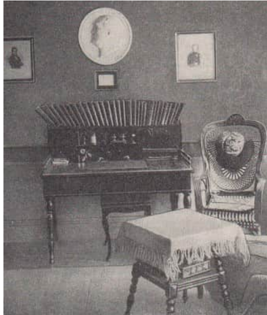
Abb. 4. Robert Mayers Arbeitsplatz

Die mechanische Wärmetheorie erst lehrt diese Tatsachen begreifen und berechnen, Da nämlich ein einziges Kilogramm Asteroidmasse, wenn es auf die Sonne einstürzt, wie ein Meteorstein auf die Erde, mindestens soviel Hitze entwickelt, als 6000 Kilogramm Steinkohlen beim Verbrennen geben, so klärt sich das Rätsel auf, wie der Zentralkörper unseres Planetensystems, die Sonne, immerwährend eine unerschöpfliche Menge von Licht und Wärme spendet, ohne je zu erkalten und in seiner Tätigkeit abzunehmen.