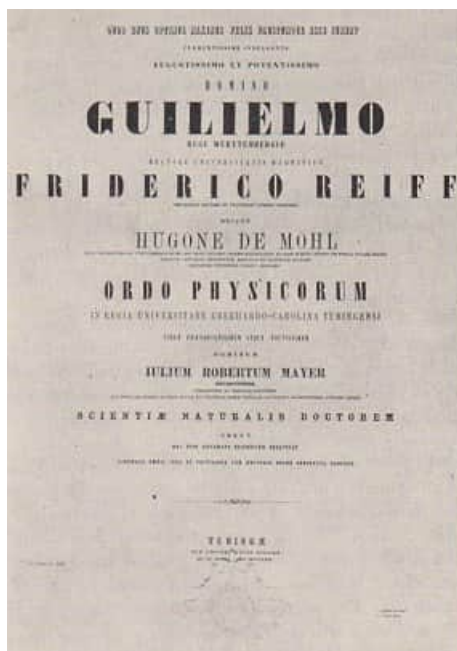
Abb. 5. Tübinger Ehrenpromotionsurkunde

Am wirkungsvollsten für ihn erwies sich die dort gemachte Bekanntschaft mit einem schwäbischen Landsmann, dem Professor für Chemie an der Universität Basel Christian Friedrich Schönbein, auf dessen Betreiben ihn die Naturforschende Gesellschaft zu Basel am 10. November 1858 zu ihrem Korrespondierenden Mitglied ernannte.