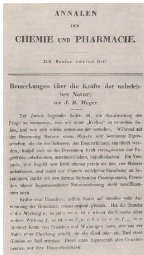
Abb.3. Erste Seite der Erstlingsarbeit (Annalen der Chemie und Pharmazie)