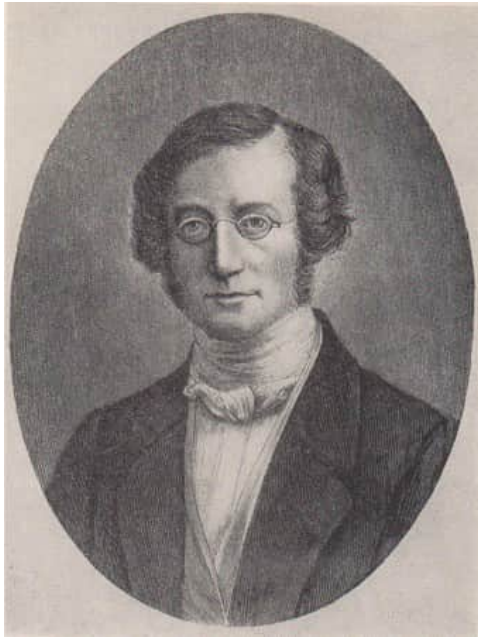
Abb.1. Robert Mayer im Alter von 28 Jahren (1842)

Wo Bewegung entsteht Wärme vergeht Wo Bewegung verschwindet Wärme sich findet. Es bleiben erhalten des Weltalls Gewalten Die Form nur verweht das Wesen besteht. Strophe am Sockel des Robert-Mayer-Denkmal im Stadtgarten von Heilbronn am Neckar