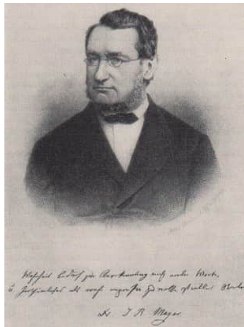
Abb. 6. Robert Mayer im Alter von 54 Jahren (1868)

Es kam zu einem freundschaftlichen Briefwechsel, in dessen Verlauf auch eine Englandreise Robert Mayers ins Auge gefasst wurde; sie kam jedoch nicht zustande.