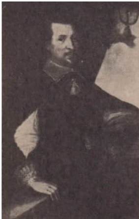
Abb. 1. Otto von Guericke, Gemälde von Lucia Maria Lauch um 1650 (im Besitz der Technischen Hochschule Otto von Guericke Magdeburg)

In Würdigung der Leistungen in Lehre und Forschung wurde der Hochschule für Schwermaschinenbau Magdeburg auf Beschluss des Präsidiums des Ministerrats der DDR im Jahre 1961 der Status einer Technischen Hochschule und der verpflichtende Name "Otto von Guericke" verliehen.