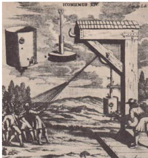
Abb. 7. Versuch, mit dem Guericke die Gewalt des Luftdruckes demonstriert hat

Vom Kolben ging eine starke Stange aus, an der ein entsprechend starkes Seil befestigt war, das über zwei am Galgen befindliche Rollen geführt wurde und an der Seite des Querbalkens wieder abwärts führte. An dieses abwärts führende Ende ließ er zwanzig oder dreißig dünnere Seile anknüpfen und jedes Seil einem kräftigen Mann in die Hand geben (Abb. 7).