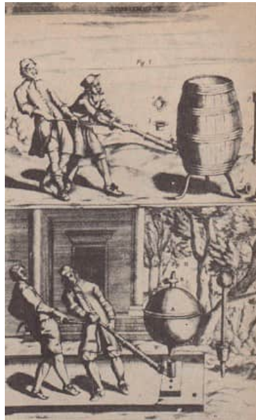
Abb. 3. Darstellung der ersten Versuche

So schilderte Guericke seinen Eindruck. Und weiter beobachtete er, dass sich die Kugel wieder mit Luft füllte, wenn man sie einige Zeit liegen ließ. Er sann deshalb, wie man diesem Übel und allen anderen Mängeln abhelfen könne.