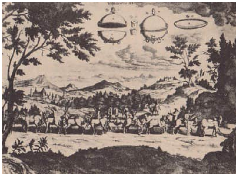
Abb. 6. Der berühmte Versuch mit den Magdeburger Halbkugeln

Guericke nahm aber nur 24 Pferde, um zu vermeiden, dass dies geschehe, weil dabei immer etwas beschädigt würde. Statt dessen ließ er einen Mann den Hahn öffnen und mit einer kleinen Handpumpe Luft in die Kugeln hineindrücken, bis sie von allein auseinanderfielen. Guericke bemerkte dazu: