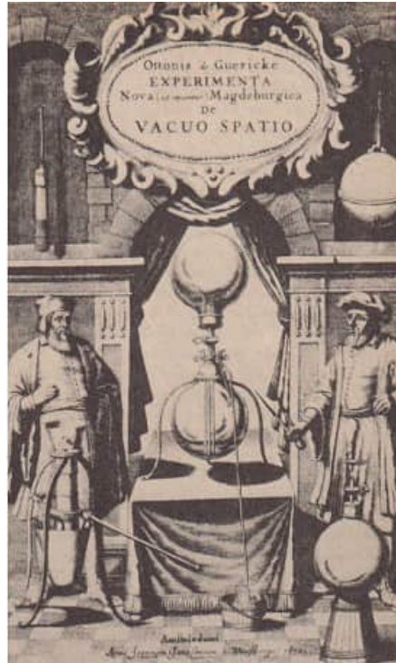
Abb. 2. Titelblatt des Werkes von Otto von Guericke

Die katholische Kirche war die Repräsentantin der feudalen Gesellschaft in allen ideologischen und geistigen Fragen. Bis zur Reformation war sie zudem der größte Grundbesitzer gewesen, dem etwa ein Drittel allen Bodens gehört hatte. Sie war auch politisch die führende Macht gewesen. Erst jetzt begann der Prozess des Übergangs der Macht an den weltlichen Teil der Feudalmächte, vor allem in Form der Herausbildung der absoluten Monarchie.