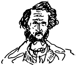
Drei Zeichnungen des jungen Engels

Dazwischen nimmt Engels Tanzstunde, lernt fechten, geht schlittschuhlaufen, beginnt zu reiten, was ihm bis in die hohen Mannesjahre hinein lieb war und wohlgetan hat. Neben der Literatur aber, die für ihn zu den Notwendigkeiten des Lebens gehörte, die er als kritischer Leser genoß und zu der er selber viel Schönes und Wichtiges beigetragen hat, entzündete sich in diesen Jahren seine Neigung zur Musik. Sie nannte er „die beste Seite Bremens“. Er schwärmt