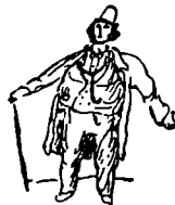
Se noble, moderne Nationalismus

Dazwischen nimmt Engels Tanzstunde, lernt fechten, geht schlittschuhlaufen, beginnt zu reiten, was ihm bis in die hohen Mannesjahre hinein lieb war und wohlgetan hat. Neben der Literatur aber, die für ihn zu den Notwendigkeiten des Lebens gehörte, die er als kritischer Leser genoß und zu der er selber viel Schönes und Wichtiges beigetragen hat, entzündete sich in diesen Jahren seine Neigung zur Musik. Sie nannte er „die beste Seite Bremens“. Er schwärmt