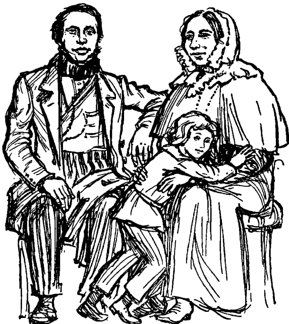
Die Eltern von Friedrich Engels

wurden. Niemand von diesen reichen Engels ließ sich freilich träumen, was einmal aus dem jungen Friedrich werden würde und daß heute eine große Straße in der Nähe seines Geburtshauses nicht der Fabriken wegen Friedrich-Engels-Allee heißt.