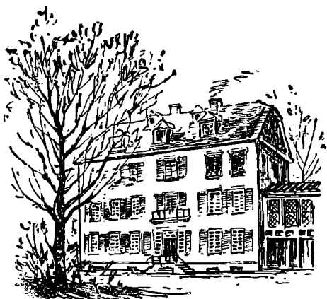
Das Geburtshaus von Friedrich Engels in Barmen