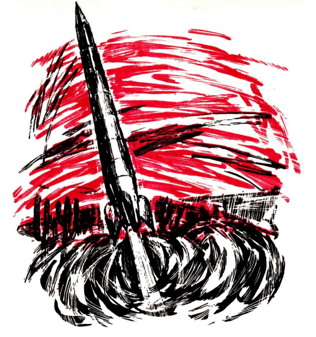
An der Grenze der Schallgeschwindigkeit

Ihre Krönung fand die Arbeit der Goddard-Gruppe am 31. Mai 1935. Längst war "Nelly" eine schlank gewachsene Rakete von 4,5 m Länge und mit einem eleganten Metallmantel verkleidet. Ein Fallschirm brachte sie nach dem Aufstieg zur Erde zurück. An diesem strahlenden Maientag nun stieß die 38 kg schwere "Nelly" bis zu einer Höhe von 2285 m vor. Die von den Instrumenten gemessene Geschwindigkeit betrug 1120 km/h. Die Rakete war also bis auf 80 km an die Grenze der Schallgeschwindigkeit vorgedrungen.