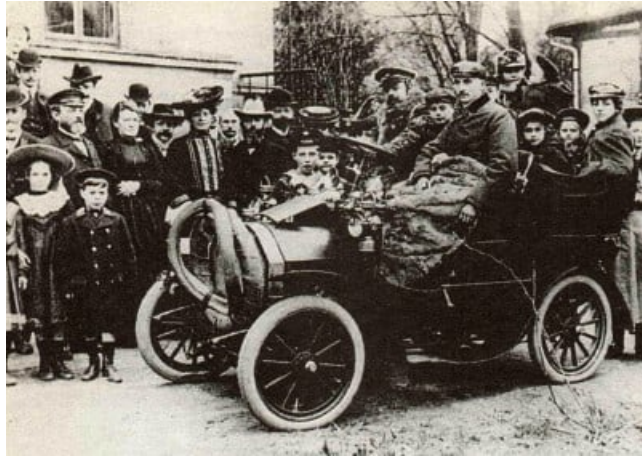
8 Vor dem Umzug von Göttingen nach Berlin im eigenen Wagen

Noch vor der Übersiedlung nach Berlin hält Nernst auf der 46. Hauptversammlung des Vereins deutscher Ingenieure 1905 in Magdeburg einen Vortrag, dessen Inhalt mehrere seiner Interessensphären zugleich widerspiegelt. Das Thema lautet "Physikalisch-chemische Betrachtungen über den Verbrennungsprozess in den Gasmotoren". In ihm werden die in der letzten Göttinger Zeit gesammelten Erfahrungen über Gasgleichgewichte aufgezeigt, aber auch das Problem, dessen Lösung Nernst wenige Monate später in Berlin fand: "seinen Wärmesatz".