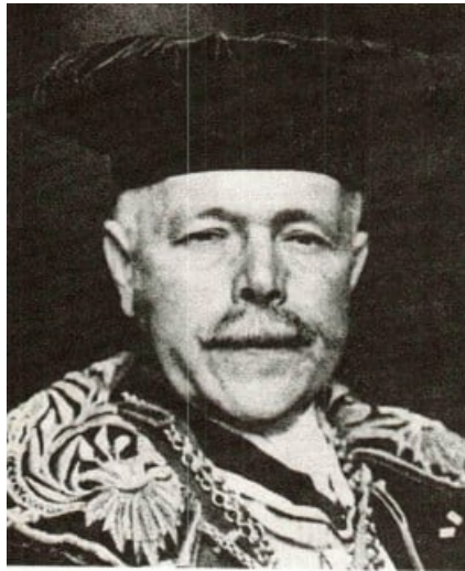
11 Nernst als Rektor der Berliner Universität 1921/22

praktische Zwecke projiziert er eine entsprechende Anlage auf dem Monte Generoso.