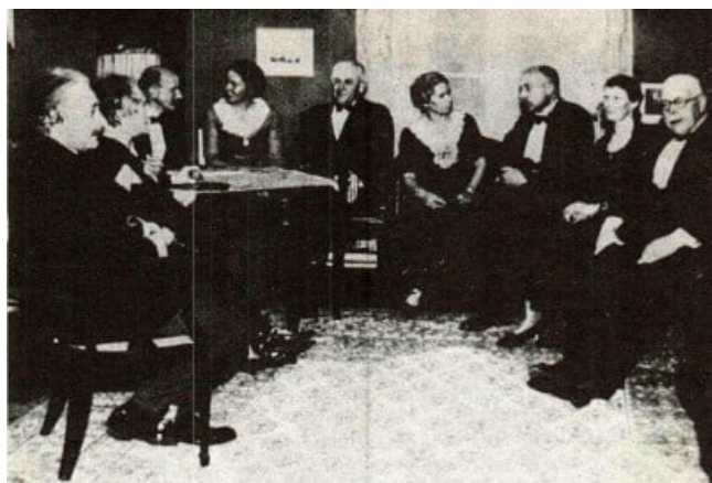
13 Fünf Nobelpreisträger, v.l.n.r.: 1. Einstein, 3. Planck, 5. Millikan, 7. v.Laue, 9. Nernst [17]

Trotz seiner Beschäftigung mit dem politischen Geschehen, das gerade in der Zeit der Weimarer Republik Nernst von den meisten seiner Kollegen unterschied, erkannte er das Erstarken des Nationalsozialismus und die damit verbundene Gefahr nicht. In einer Rundfunkrede im Dezember 1930 bekundet er sogar einen gewissen Optimismus, wenn er sagt: