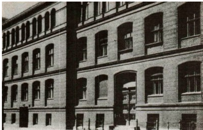
9 Das Institut für physikalische Chemie in der Berliner Bunsenstrasse, nach 1909

Das erste Quartier wurde in der Moltkestraße unweit des Reichstagesgebäudes und der neuen Wirkungsstätte genommen.