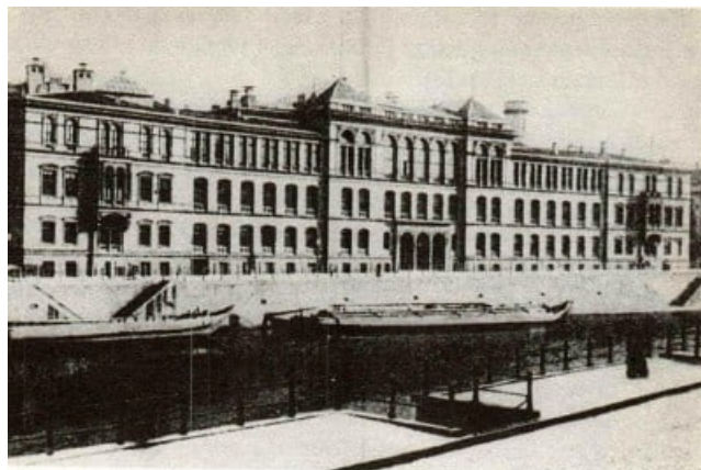
12 Das Physikalische Institut am Reichstagufer (Mitte), das Institut für physikalische Chemie (links) und die Direktoren-Villa (rechts)

"Nach längerer Beratung hat die Fakultät davon abgesehen, die Nobelpreisträger P. Lenard und J. Stark auf ihre Liste zu setzen, weil diese bedeutenden Gelehrten infolge ihrer leidenschaftlichen und nicht immer sachlichen Bekämpfung der neueren theoretischen Physik das gedeihliche Zusammenleben der Berliner Physiker gefährden würden." [34]