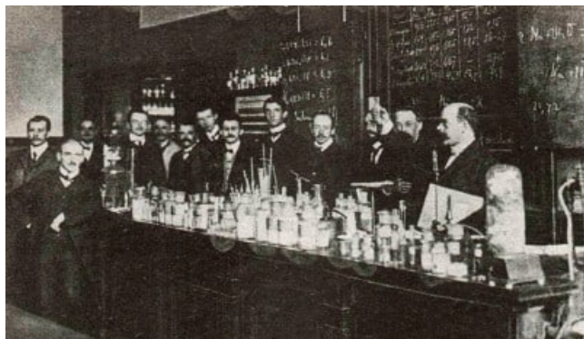
10 Im Hörsaal des Instituts in der Bunsenstraße, Sommersemester 1906

August Wilhelm v. Hofmann erreichte während seines Rektorats 1880/81, dass das neue Gebäude das II. chemische Laboratorium beherbergen sollte, welches dann 1883 eröffnet wurde. Der erste Direktor war Carl Friedrich Rammelsberg, unter dessen Leitung über Mineral- und anorganische Chemie gearbeitet wurde. Nach seiner Emeritierung 1891 übernahm Landolt das Direktorat. In der ersten Etage wurde das technologische Institut eingerichtet.