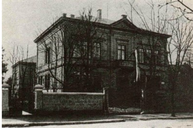
3 Das Göttinger Institut für physikalische Chemie und Elektrochemie, vor 1906

Mitte August 1896 fährt er zum "Mechanikertag" nach Berlin. Im Zusammenhang mit einer dabei veranstalteten Ausstellung will er Material für sein Institut und dessen Ausstattung sammeln. So reiht sich eine Bemühung an die andere. Erst am 15. Mai 1897 kann Nernst feststellen: