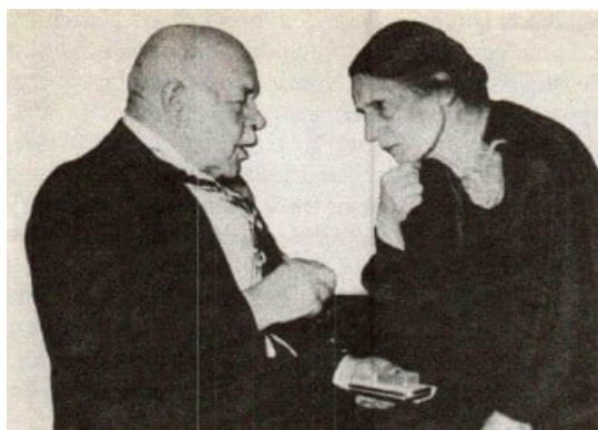
14 Walther Nernst im Gespräch mit Lise Meitner [43]

So ehrenvoll diese Auszeichnungen sind, weitaus mehr zählen die anerkennenden, dankbaren und z.T. liebevollen Äußerungen von vielen bedeutenden Wissenschaftlern, die aus der von Nernst begründeten Schule hervorgingen, sowie der Kollegen, mit denen er in direkter oder indirekter Weise auf seinem Lebensweg verbunden war. Hiervon zeugen die Aufsätze im Zusammenhang mit Jubiläen und Gedenktagen sowie die Nekrologe.