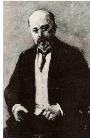
1 Walther Nernst (25. 6. 1864 bis 18. 11. 1941) (Porträt von Max Liebermann, 1912)

Eines Menschen Leben, was ist's? Doch Tausende können Reden über den Mann, was er und wie er's getan. J.W.v. Goethe (Venezianische Epigramme 36)