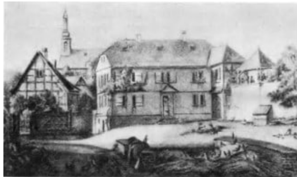
Abb. 2. Lichtenbergs Geburtshaus in Oberramstadt, in dem er die ersten drei Lebensjahre verbrachte

Das Leben der Familie Lichtenberg war durch die deutsche Aufklärung in ihrer Aufgeschlossenheit, Vielseitigkeit und in ihrem geistigen Reichtum, aber auch durch ihre Widersprüchlichkeit geprägt.