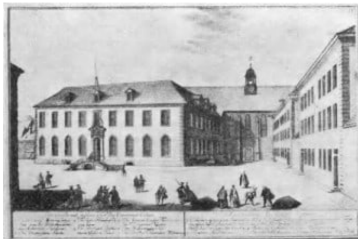
Abb. 3. Das Gebäude der Göttinger Universität. Im ersten Stock befindet sich die Bibliothek, rechts sind einige Professorenwohnungen (Stich von G. D. Heumann aus dem Jahre 1747)

Die Wissenschaft sollte dem Leben dienen, und mit ihrer Hilfe sollten Männer ausgebildet werden, die sich in der Welt und in ihren Geschehnissen auskannten - keine Pedanten.