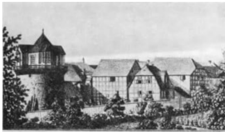
Abb. 4. Die Sternwarte in Göttingen