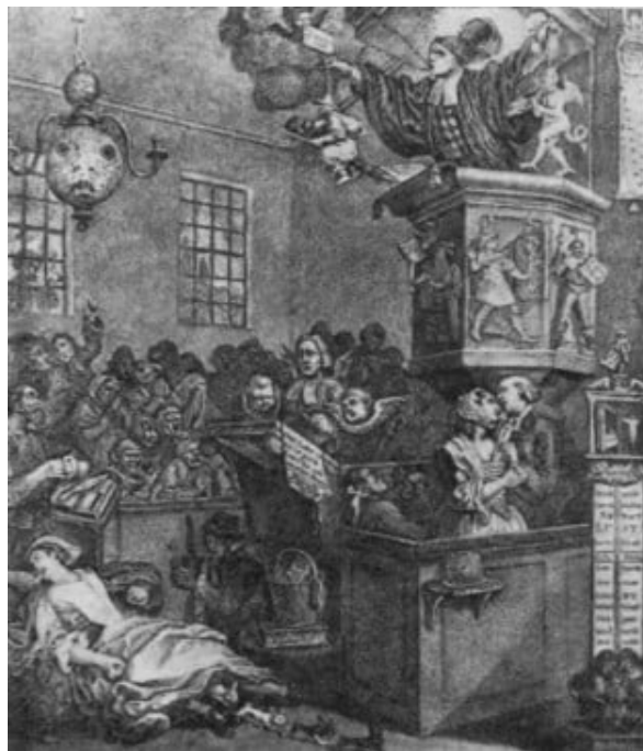
Abb. 10. "Leichtgläubigkeit, Aberglaube und Fanatismus" (Kupferstich von Hogarth)

Lichtenberg führt einen unerbittlichen und harten Kampf gegen die Theologen, die "falsch verstandene Beobachtungen mit ungeheuren und wiederum falschen Folgerungen daraus" in ihren Schriften zusammentragen und als "Weissagungen" verkaufen. Eine dieser in Deutschland weit verbreiteten Schriften waren die "Weissagungen" des Superintendenten Ziehens, in der der Verfasser den Untergang Europas verkündete. [1; Bd. 4, S. 214 f.]