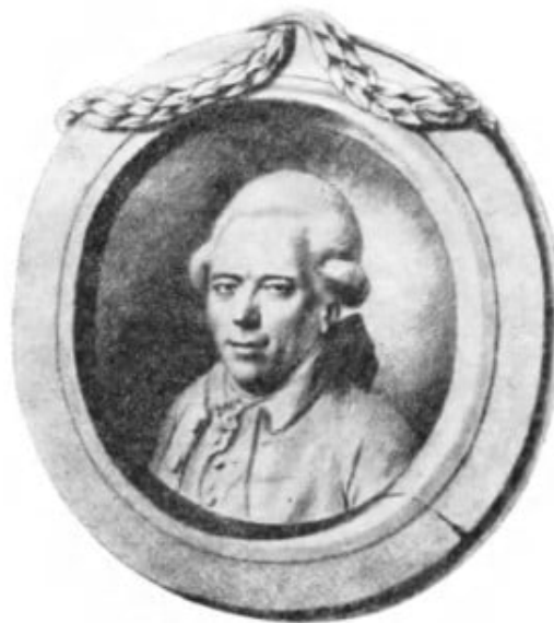
Abb. 8. Georg Christoph Lichtenberg im Jahre 1780 (Pastellzeichnung von J. L. Strecker)