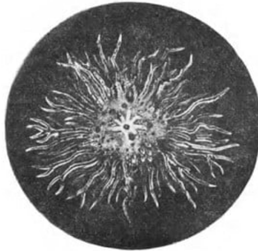
Abb. 6. Eine sog. elektrische Figur aus der Arbeit Lichtenbergs "Über eine neue Methode..."

"De Luc und Volta haben sich über 2 Monate mit meinen Figuren beschäftigt und man hat nun ein gewichtiges Werk vom ersteren zu erwarten (ist nicht erschienen - d. Verf.). Er schrieb vor einiger Zeit mehr witzig vielleicht als wahr: Ihre Sterne werden Dereinst noch in der Nacht der Elektrizität leuchten." [7; Bd. 2, S. 86]