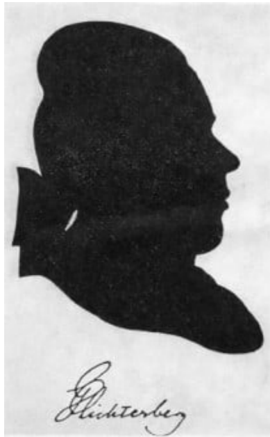
Abb. 1. Georg Christoph Lichtenberg (1. 7. 1742-24. 2. 1799) Schattenriss aus dem Jahre 1777

Lichtenbergs Schriften können wir uns als der wunderbarsten Wünschelrute bedienen; wo er einen Spaß macht, liegt ein Problem verborgen. Goethe: Maximen und Reflexionen