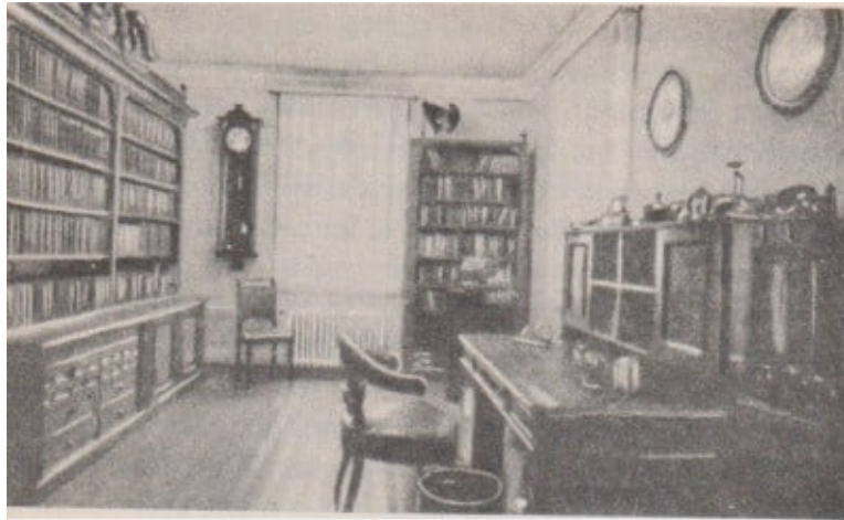
Abb. 5. Arbeitszimmer Wilhelm Conrad Röntgens

der Physik beitragen durften, im Persönlichen leider nur den Weg zu einem verhängnisvollen Missverstehen fanden.