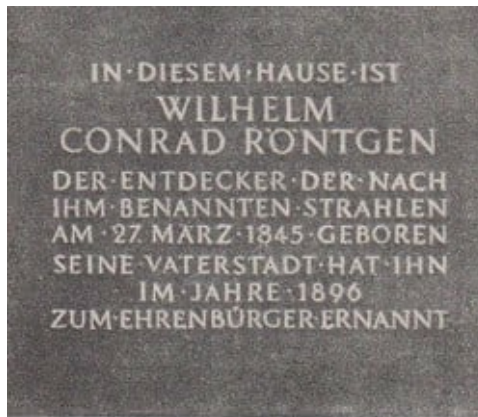
Abb. 4. Gedenktafel am Geburtshaus Röntgens

Am 23. Mai 1848 wurde dem Vater Friedrich Conrad Röntgen der beantragte Consens zur Auswanderung nach Holland. ausgefertigt und mit der Bemerkung übergeben: "..., daß mit der Empfangnahme desselben er der Eigenschaft als Preußischer Unterthan entsage..."