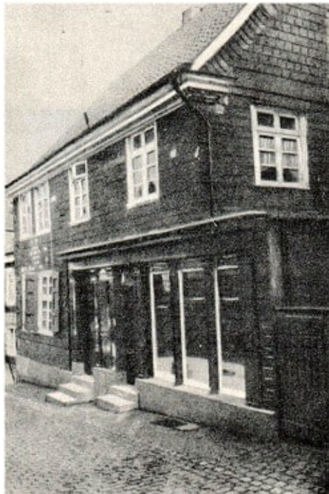
Abb. 3. In diesem Hause in Remscheid-Lennep wurde Wilhelm Conrad Röntgen am 27. 3. 1845 geboren

Wilhelm Conrad Röntgen wurde am 27. März 1845 in Lennep im Bergischen Land 2 geboren.