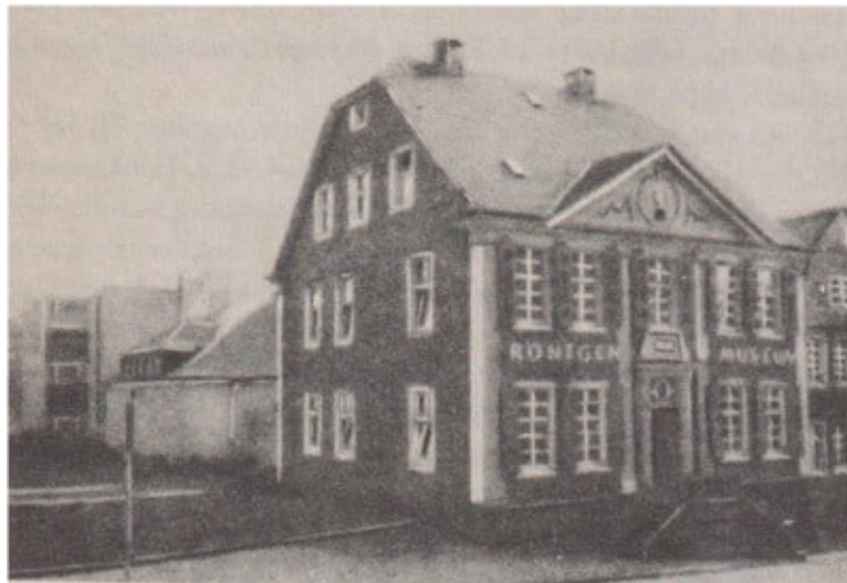
Abb. 6. Das Deutsche Röntgen-Museum in Rensselaer-Lenape mit dem Altbau und den jetzt damit verbundenen Neubauten im Hintergrund

In den Münchener Jahren nahm Röntgen seine Experimente über die Kristalle wieder auf und veröffentlichte zum Teil zusammen mit seinem Schüler Joffe, der später durch seine Untersuchungen über die Festkörper bekannt wurde, mehrere Arbeiten.