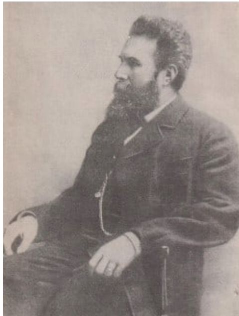
Abb. 1. Wilhelm Conrad Röntgen

Am 28. Dezember 1895 übergab der Direktor des Physikalischen Institutes an der Bayerischen Julius-Maximilians-Universität zu Würzburg, Prof. Dr. Wilhelm Conrad Röntgen, dem Sekretär der Physikalisch-Medizinischen Gesellschaft an der Universität Würzburg das Manuskript seiner Arbeit