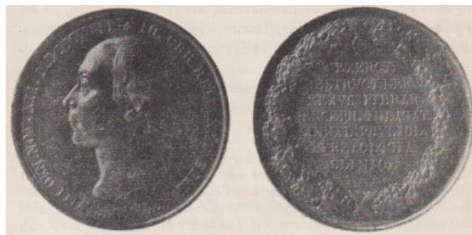
Abb. 7. Reil-Gedenkmünze

Beiträge ähnlichen Inhalts veröffentlicht Reil unter dem Pseudonym „X-r“ auch in der Zeitschrift „Mannigfaltigkeiten“ (z. B. „Etwas über die Schnürbrüste“). Fast noch bedeutsamer als derartige Verhaltensregeln sind aber jene gesundheitserzieherischen Forderungen, die den wesentlichen Bestandteil des Schlusskapitels der Abhandlungsfolge bilden. Hier geht es um die Reform der schulischen Erziehung, um die Beseitigung antiquierter Verhältnisse, Reil fürchtet, dass die von ihm gerügten Bedingungen zur physischen und psychischen Beeinträchtigung des jugendlichen Organismus führen müssten. Beim Schulgebäude selbst müsse eine sinnvolle Reorganisation beginnen: