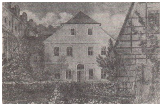
Abb. 8. Das Klinikum am halleschen Domplatz

Als Professor der Therapie steht dem zum Dr. phil. honoris causa gekürten Reil jetzt ein internistisches Bettenkrankenhaus zur Verfügung, das am Domplatz im ehemaligen Reformierten Gymnasium eingerichtet wird; im preußischen Junkerstaat waren diese Projekte auf taube Ohren gestoßen.