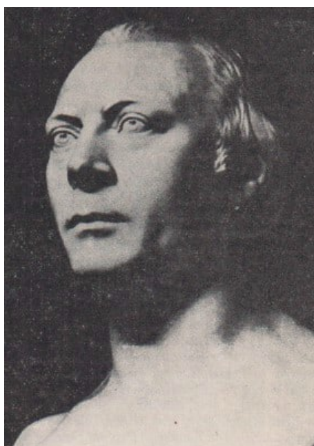
Abb. 2. Die 1852 von Ernst Rietschel (1804-1861) geschaffene Reil-Büste

Die Rückständigkeit der Medizin in den meisten deutschen Territorialstaaten äußert sich aber nicht nur auf dem Sektor der von Systematisierungsversuchen erschütterten inneren Medizin. Noch deutlicher wird sie auf dem Gebiet der Wundarzneykunst, die in Frankreich und England bereits hohes Renommee genießt, als sie an den deutschen Universitäten um ihre Gleichberechtigung ringt.