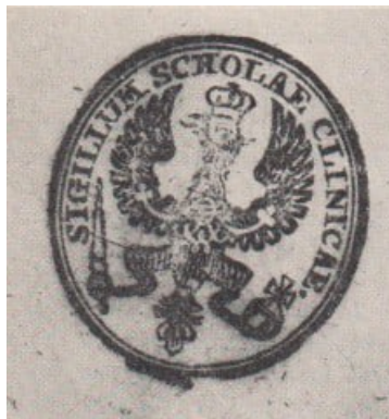
Abb. 3. Das Siegel der halleschen Schola clinica

Auch seitens der Universitätsbehörden weiß man die Assistenz von Reil bald zu schätzen, denn bereits am 16. Oktober 1787 überträgt man ihm ein Extraordinariat.