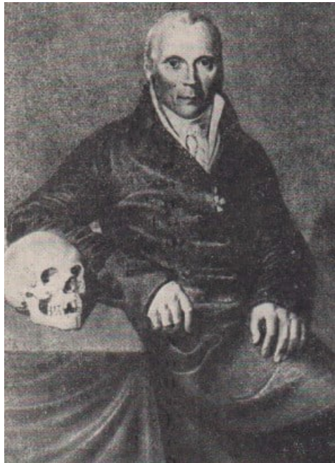
Abb. 1. Johann Christian Reil (1759-1813)

Bezeichnungen wie Reilstraße, Reileck, Reilshof und Reilsberg (Zoo) sind in der Stadt Halle fest eingewurzelte Begriffe. Sie halten die Erinnerung an Leben und Werk von Johann Christian Reil (1759-1813) wach, wobei den ortsfremden Passanten der Reilstraße ein am Straßenschild angebrachter Zusatz „Arzt und Professor, ein Wohltäter unserer Stadt“ zunächst grob informiert.