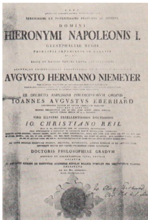
Abb. 4. Diplom über Reils Ehrendoktorat in der Philosophischen Fakultät (16. Mai 1808)

Das Idealbild des sowohl auf dem Gebiet der Philosophie als auch der Naturwissenschaft schöpferisch tätigen Gelehrten bildete für Reil ein überaus erstrebenswertes Ziel. Jedoch die Zeit des anbrechenden 19. Jahrhunderts markierte einen Umschlag in dieser Beziehung von Philosophie und Naturwissenschaft. Die Epoche der Differenzierung und Spezialisierung der Wissenschaften begann sich verstärkt durchzusetzen. Es wurde zunehmend schwieriger, das Gesamtgebiet des Wissens zu überblicken. Nun hatte dieser Spezialisierungsprozess zweifellos viele positive Seiten, ja, er war ein objektives Erfordernis der weiteren Wissenschaftsentwicklung, denn er ermöglichte die vertiefte Ausarbeitung der wissenschaftlichen Forschungsmethoden und gleichzeitig auch, manche spekulative Theorie kritisch zu überprüfen und, wenn sie als untauglich erwiesen war, über Bord zu werfen. Jedoch auch Nachteile zeigten sich.