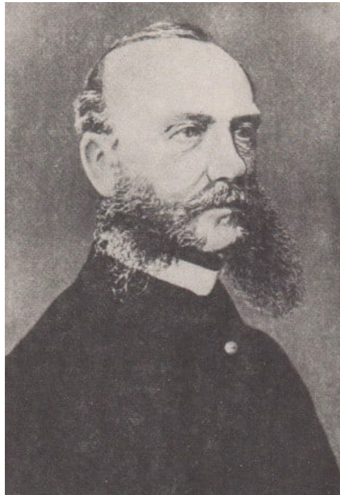
Abb. 1. Wilhelm Griesinger

Wilhelm Griesingers Wirken als Psychiater hat nur einen Teil seiner ärztlichen Tätigkeit ausgemacht. Trotzdem gilt er mit Recht als der Begründer der modernen Psychiatrie in Deutschland und deren internationaler Geltung. Bei seiner Ausbildung in der Medizin hatte er Gelegenheit, sich über den jüngst erreichten Fortschritt in den naturwissenschaftlichen Fächern und in der Klinik zu unterrichten.