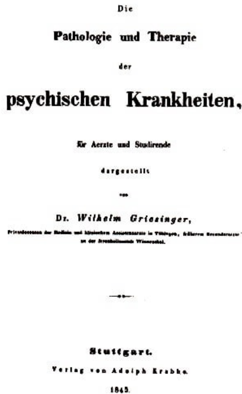
Abb. 2. Titelseite der 1. Auflage der Pathologie und Therapie der psychischen Krankheiten

deutung des Irreseins als einer Erkrankung zu wahren, und es lag in der Natur der Dinge, dass die Tatsachen und Argumente über Entstehung des Irreseins mit und im Gefolge anderweitiger Erkrankung - die Seite der Sache, wo seine eigene krankhafte Natur am offensten darlag - bald zu obersten Hauptgrundsätzen, zu Prinzipien einer psychiatrischen Schule ausgeprägt wurden."