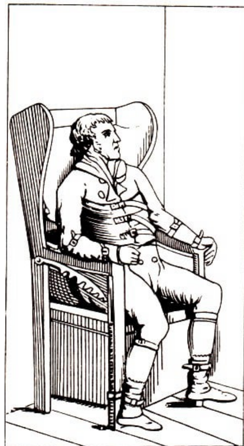
Abb. 3. Zwangsstehen ; Abb. 4. Zwangsstuhl

Die Periode, in der solche Methoden eine wesentliche Rolle in der Therapie spielten, fühlte sich der vorausgegangenen mit der völligen Vernachlässigung der Geisteskranken hoch überlegen, und dem ist es mit zuzuschreiben, dass sie bei einer beträchtlichen Anzahl von Fachvertretern geduldet wurden. E. Horn beispielsweise bemühte sich mit großem persönlichen Einsatz um die Beseitigung willkürlicher Kränkungen und Züchtigung der Patienten und setzte sich mit unermüdlichem Eifer für die Hebung des Niveaus des Pflegepersonals und die Verbesserung von dessen sozialer Lage ein.