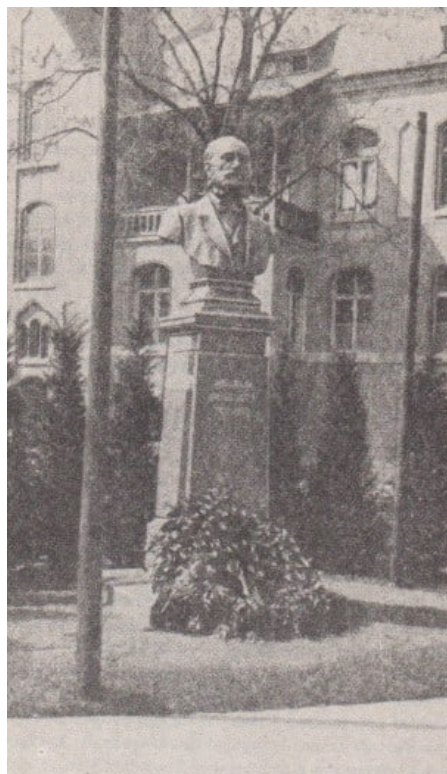
Abb. 7. Wilhelm-Griesinger-Bronzebüste vor der Nervenklinik der Berliner Charite Von den Anschauungen, für die er frühzeitig eingetreten war, galt ein Teil gegen Ende seines

Die große Reihe wertvoller Beiträge, die als Einzelveröffentlichungen Griesingers hauptsächlich im "Archiv für physiologische Heilkunde" (bzw. "Archiv der Heilkunde") und im "Archiv für Psychiatrie und Nervenkrankheiten" Aufnahme gefunden hatten, gab Wunderlich 1872 in einem zweibändigen Sammelwerk heraus. Man findet darin die große Mehrzahl all dieser Arbeiten vereinigt und zwar im ersten Band die mit psychiatrischer Thematik, in dem umfänglicheren zweiten die übrigen.