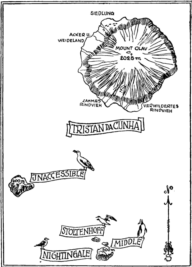
Die große und die vier kleinen Inseln, die die Inselgruppe Tristan da Cunha bilden.