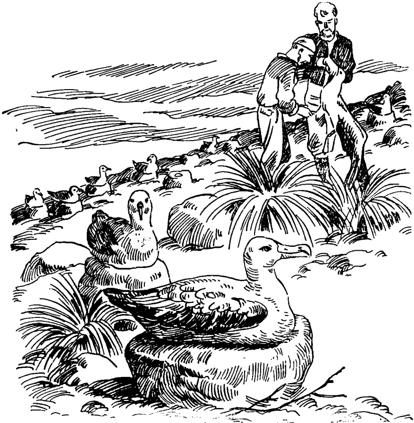
Im Februar versah ich ungefähr fünfhundert Mollys mit einem Ringe des Zool. Museums Oslo.

regnet und ein ständiger Regenstrom über das Gebirge rieselt, ist es sehr praktisch, daß das Nest so hoch gebaut ist. Ein Viertelmeter über dem Boden liegt das Weibchen trocken und sicher und wärmt seinen kostbaren Schatz etwa zwei Monate lang. Wenn das Ei nicht vorher geraubt wird, kriecht ungefähr am 1. Dezember ein kleines, in weißen Flaum gehülltes Geschöpf heraus. Das Junge ist gierig und frech, von unglaublichem Appetit und Selbstbewußtsein besessen, Eigenschaften, mit denen es sich im Laufe von drei Monaten in einen drei Kilo schweren, lärmenden Fetklumpen verwandelt, der schwerer als die Eltern ist. Kein Wunder, denn in diesen drei Monaten tragen die Eltern unglaublich viel Fisch, Tintenfisch und Garnelen aus dem Meer herbei, kräftige Kost, die die Mutter nicht im Schnabel, sondern im