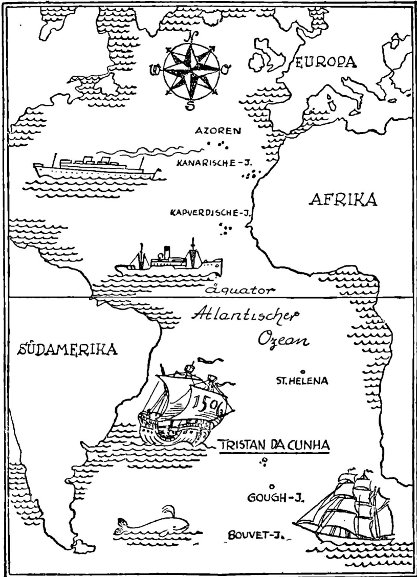
Lage der Inselgruppe Tristan da Cunha im Süd-Atlantik